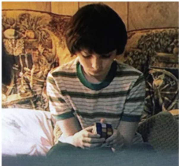
Mike, Stranger Things