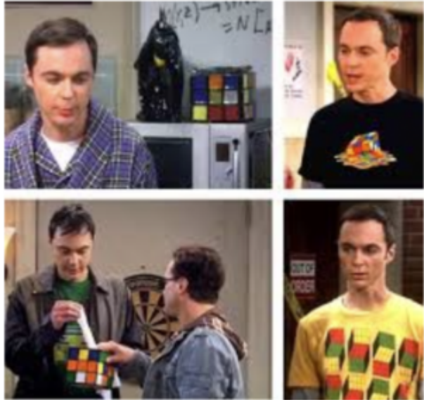
Sheldon Cooper, Big Bang Theory